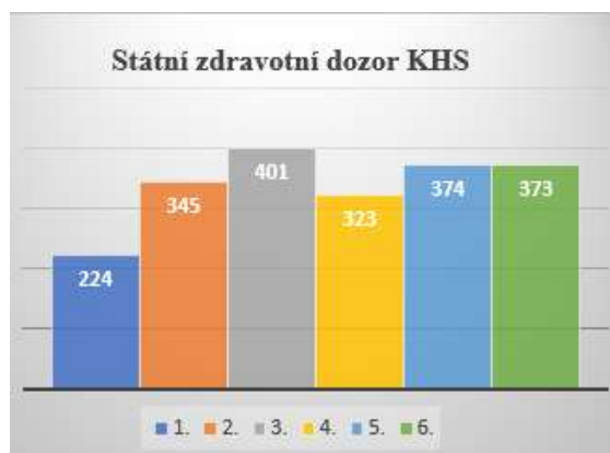
Graf č. 1: SZD v měsících leden až červen 2023

Rozsáhlou agendu činnosti KHS představovalo ověřování podmínek vzniku onemocnění pro účely posuzování nemocí z povolání. Za tímto účelem se uskutečnilo 570 šetření. Nejčastěji se jednalo o ověřování podmínek práce pro diagnózu nemoci přenosné a parazitární.